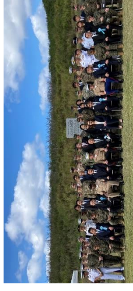
（再会記念碑前にて）