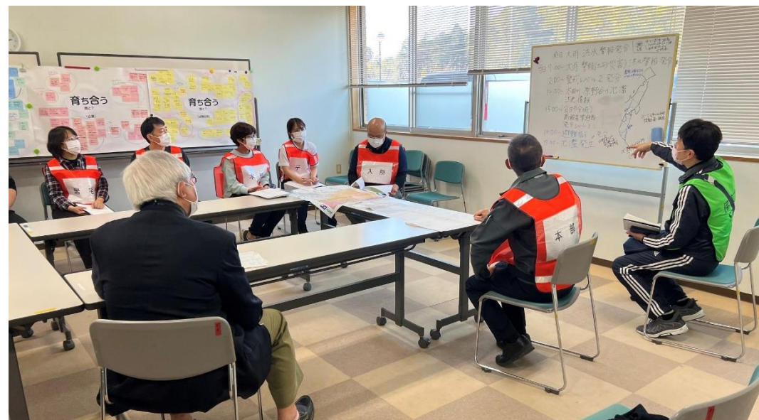
○合同防災訓練の実施