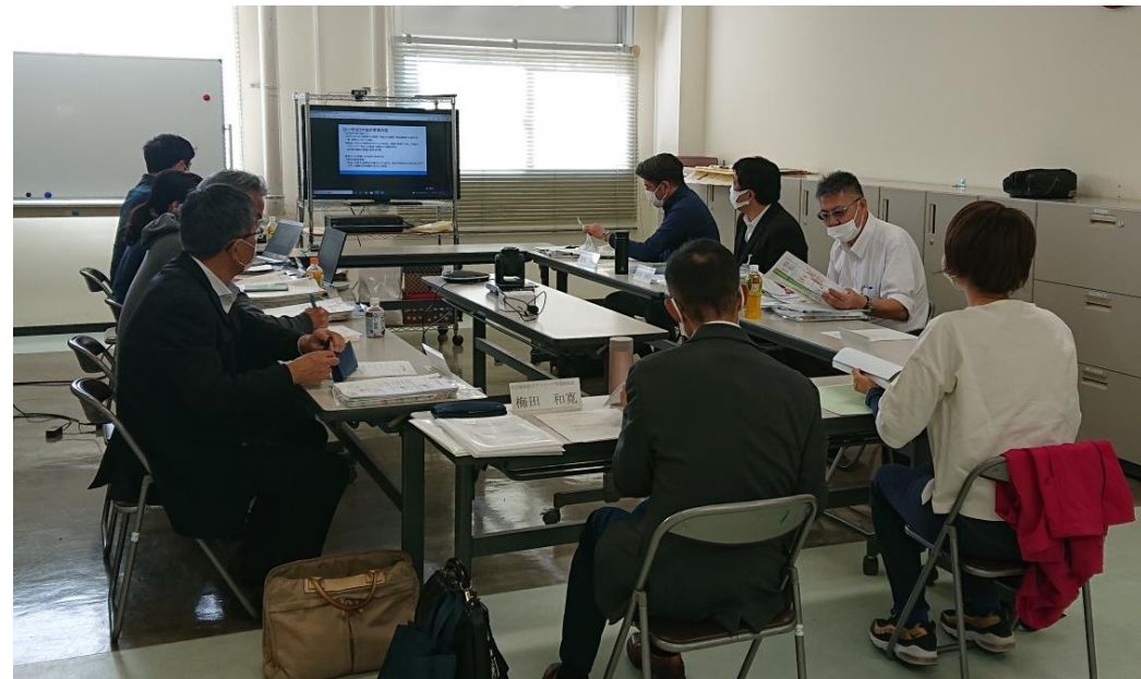
○福祉避難所運営について情報交換