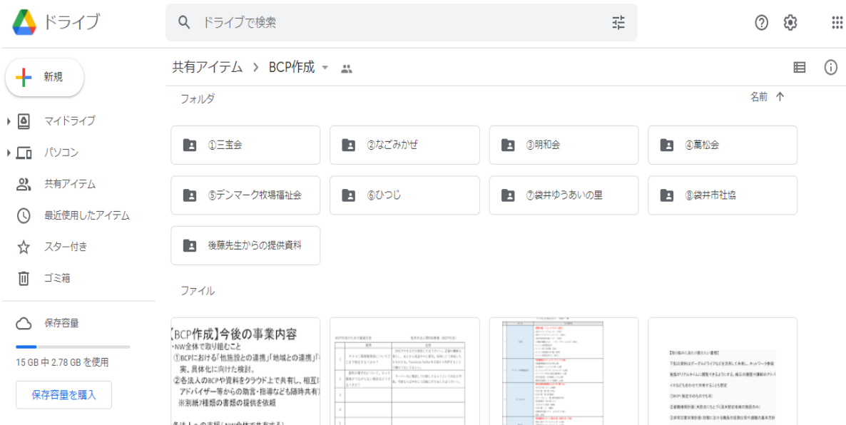
○BCP策定支援(Googleドライブを活用して資料の共有)