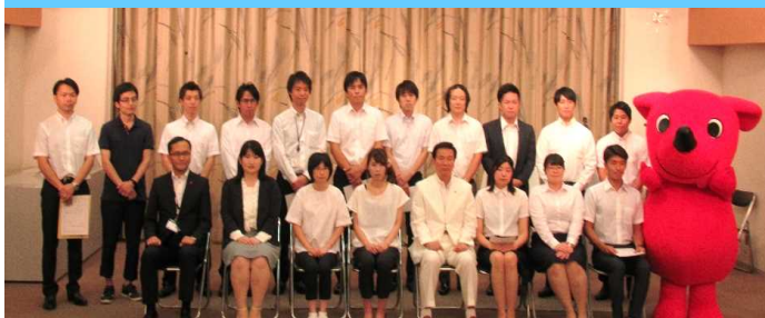
介護の未来案内人と森田健作知事(H30.8.3委嘱状交付式の様子)

20代～30代の介護職の 現役スタッフが学校を訪問し、 仕事の魅力はもちろん、プライベートの 過ごし方まで紹介します！