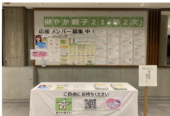
健やか親子21(第2次)の展示ブース