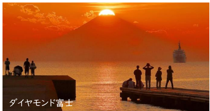
ダイヤモンド富士