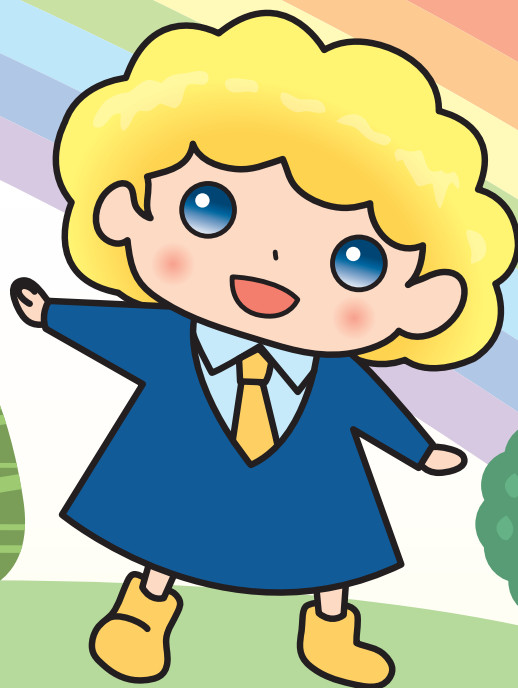
パートタイム・有期雇用労働法 キャラクター「パゆう」ちゃん