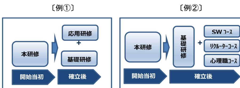
図表 6 将来的な研修カリキュラムの構成について（イメージ）

今後、研修を実施する中で得られた気づきや、里親養育における支援ニーズ、養育を担う人材の育成状況等を踏まえ、研修ニーズに合わせたカリキュラムにしていくことが必要になるであろう。その場合にあって、今回のカリキュラムを作成するに先立って整理した人材育成のポイントは、検討の際の基礎資料として役立つと思われる。ぜひ活用していただきたい。