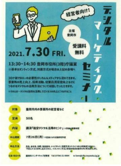
注) 経営者向け啓発セミナーポスター