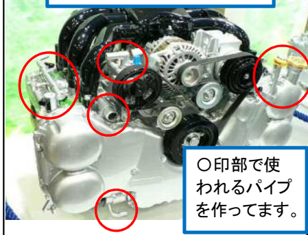
〇印部で使われるパイプを作ってます。

普段知らずに使っていたパイプ。簡単なようで難しい加工技術を習得し自分で自在に作り上げる楽しさがあります。