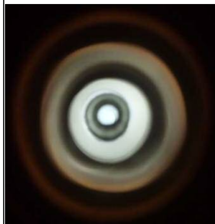
異種金属パイプ 溶接部内面画像