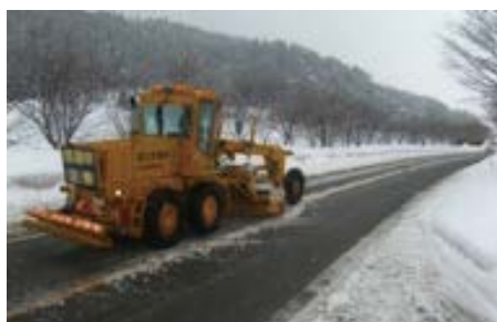
国道 157 号線