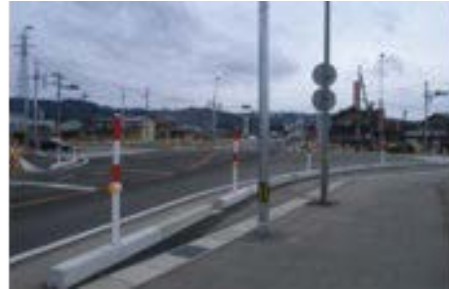
国道 159 号線