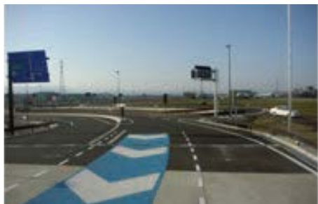
北陸自動車道白山 IC