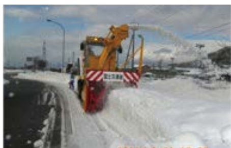
国道 157 号線