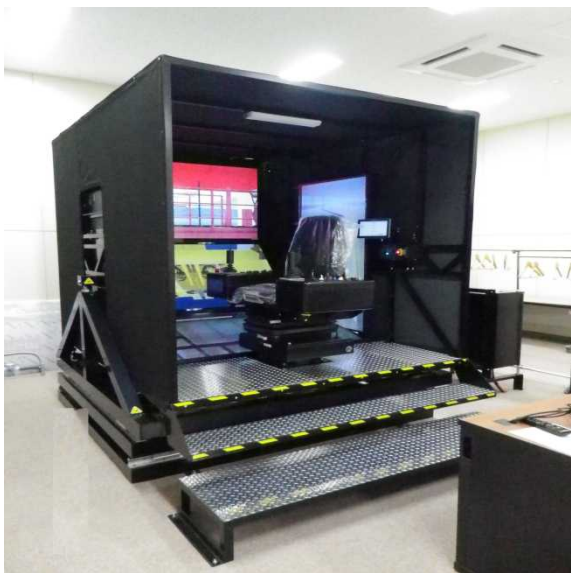
シミュレーターの外観

→ 平成26年12月に港湾技能研修センターにシミュレーターを導入（平成27年4月より講習実施予定）