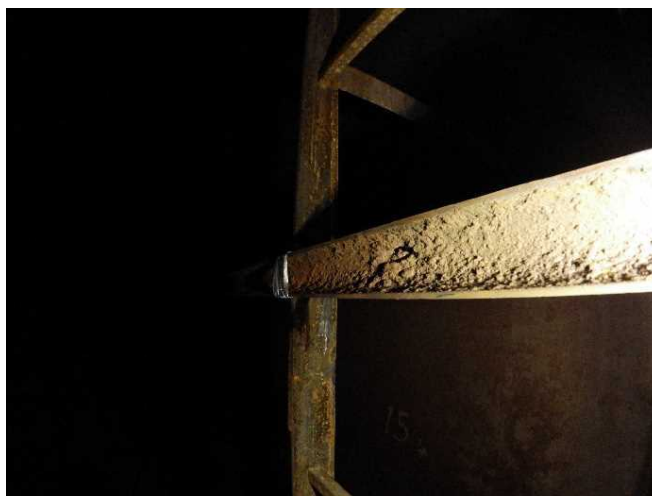
腐食のテストピース