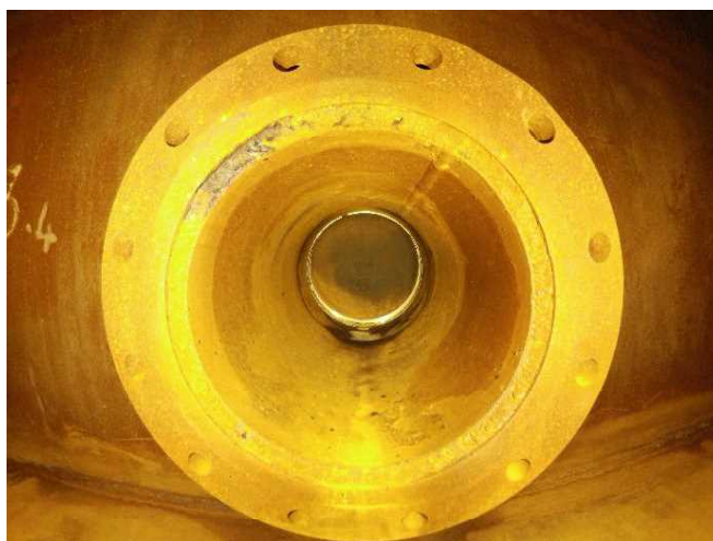
タンク底面のノズル