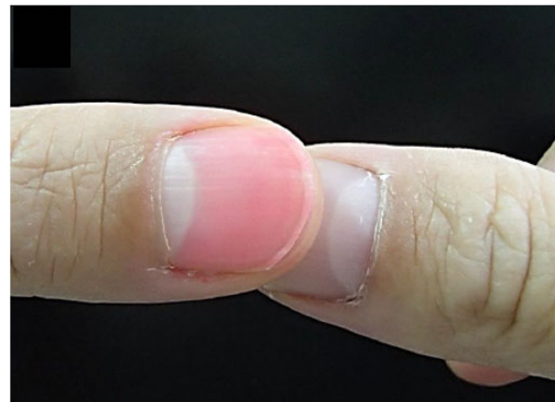
つまんだ指を離したとき、白かった爪の色がピンクに戻るのに3秒以上かかれば脱水症を起こしている可能性があります