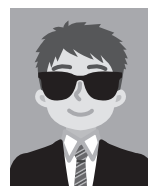
9 色の濃い眼鏡などをかけているもの（瞳が確認できないものは不可）