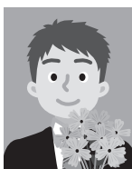
6 人物の手前に物が写り込んでいるもの