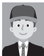
7 帽子などをかぶっているもの