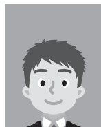
3 上三分身（胸から上の写真）でないもの