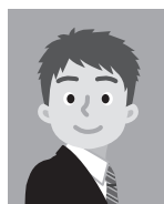
11 平常の表情と著しく異なるもの