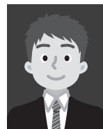
4 着衣と背景が類似色のもの