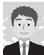
5 背景が無地でないもの