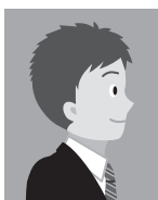
10 正面を向いていないもの（顔が正面を向いていても体が横を向いているもの、視線が正面を向いていないものは不可）