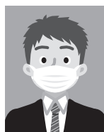
8 マスクをしているもの