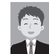
11 平常の表情と著しく異なるもの