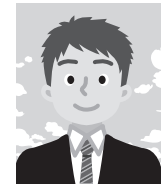
5 背景が無地でないもの