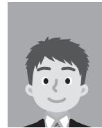
3 上三分身（胸から上の写真）でないもの