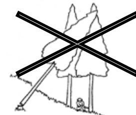
(図2) かかられている木の伐倒