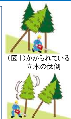
(図1)かかられている立木の伐倒