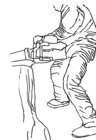
(図4) 下肢の切創防止用保護衣