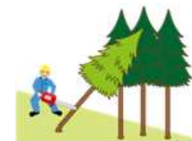
(図3)かかっている木の元玉切り