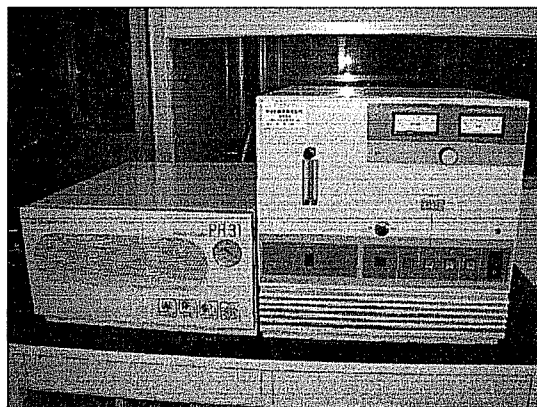
写真2 低温灰化処理装置の例

その後、透明化処理したサンプルは低温灰化処理を行う。この作業を行うことによって有機質繊維を除去することができ、セラミックファイバーを含む無機質繊維（他の人造鉱物繊維も含む）として、計数分析することが可能になる。写真2に低温灰化処理装置の例を示す。