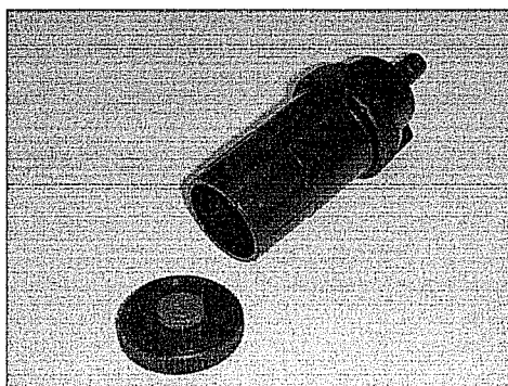
写真 1 カウル付ホルダーの例 (25mm φ のろ紙装着用)

フィルターホルダーは、カウル付のオープンフェース型ホルダーを用いる。写真 1 にカウル付ホルダーの写真を示す。