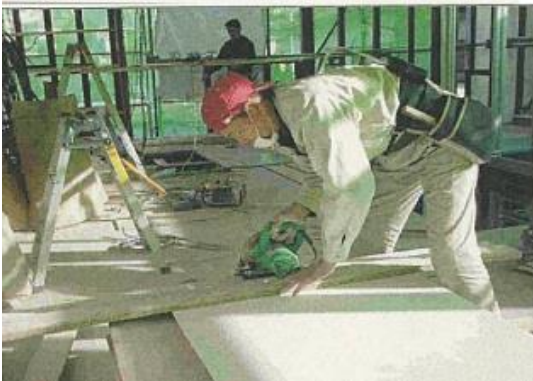
石綿ケイカル板切断作業