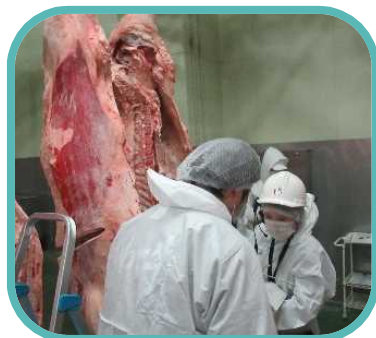
海外向けに輸出される食肉の取扱施設の認定