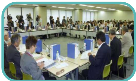
関係者会議の開催

厚生労働省で働く獣医系技官が、キャリアパスや現在取り組んでいる業務について具体的にご紹介します！