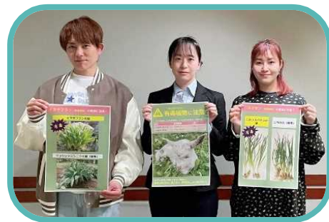
食品安全に関する知識の普及啓発