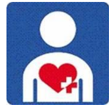
29 【ハート・プラスマーク】 30 所管：特定非営利活動法人 ハート・プラスの会