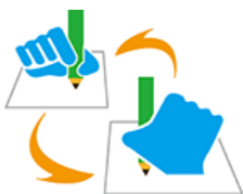
44 【筆談マーク】 所管：一般財団法人全日本ろうあ連盟