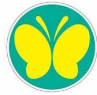
13 【聴覚障害者標識】 14 所管：警察庁