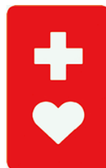
36 【ヘルプマーク】 37 所管：東京都福祉保健局障害者施策推進 部 計画課社会参加推進担当