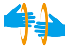
38 【手話マーク】 39 所管：一般財団法人全日本ろうあ連盟