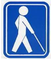
17 【盲人のための国際シンボルマーク】 18 所管：社会福祉法人日本盲人福祉委員会