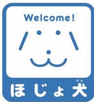
25 【ほじょ犬マーク】 26 所管：厚生労働省社会・ 援護局障害保健福祉部