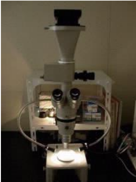
図2 斜光法による分離培地上の 集落観察