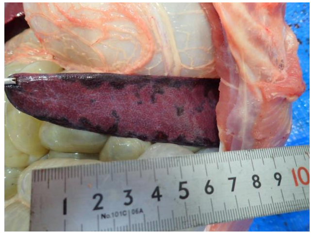
脾臓の出血性梗塞