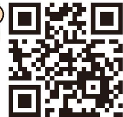
イラスト: 羽海野チカ / 協力: 白泉社