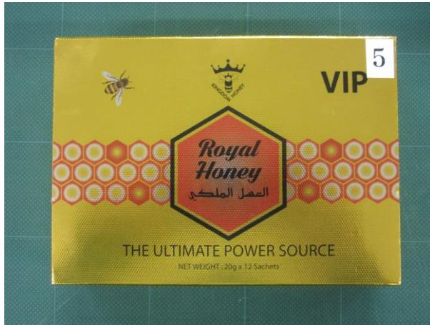
Royal Honey VIP