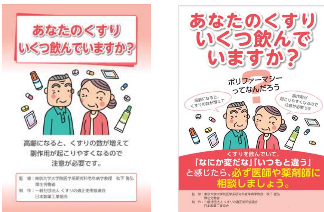
図1 一般社団法人くすりの適正使用協議会ウェブサイト「あなたのくすりいくつ飲んでいきますか」のパンフレット(図左)、ポスター(図右)のイメージ

https://www.rad-ar.or.jp/knowledge/post?slug=polypharmacy