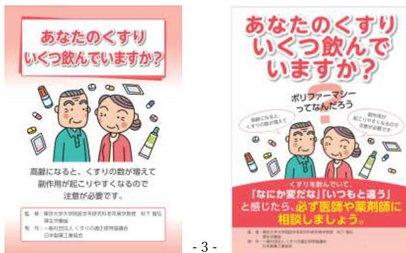
図1 一般社団法人くすりの適正使用協議会ウェブサイト「あなたのくすりいくつ飲んでいきますか」のパンフレット(図左)、ポスター(図右)のイメージ

https://www.rad-ar.or.jp/knowledge/post?slug=polypharmacy