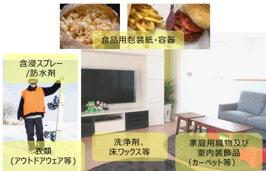
21 図 5-1 居住住居室内及び身の回りの製品における PFHxS 含有製品イメージ

1 2 3-2 の含有製品と濃度の確認において、PFHxS を含有する製品種、検出率及び含有濃 3 度は大部分が検出下限値未満又は数 ng/g 以下の低濃度であった。したがって、本リス 4 ク評価で着目する暴露源となる製品群としては、室内で多くの面積を占有し、接触頻度 5 及び接触面積が大きいと考えられるカーペットを主たるものとし、居住住宅の室内空気 6 及びダストに関しては国内外のモニタリング情報を参考として、暴露評価を行うことと 7 する。