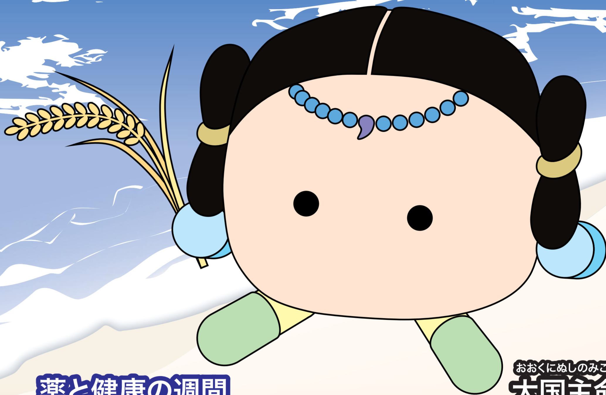
薬と健康の週間 オリジナルキャラクター