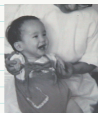
※写真は、ご本人が幼少時のものです。

ことはないと思っています。力強く生きることで苦難を乗り越えるしかないのです。このサリドマイドが、現在、再び認可され使われています。多発性骨髄腫という血液のがんやハンセン病の症状に効果があることが分かったためです。薬そのものが悪いのではない——二度と同じような被害を起こさないために、この薬の危険性をよく知って、慎重に使用してほしいと思います。