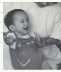
※写真は、ご本人が幼少時のものです。

ことはないと思っています。力強く生きることで苦難を乗り越えるしかないのです。このサリドマイドが、現在、再び認可され使われています。多発性骨髄腫という血液のがんやハンセン病の症状に効果があることが分かったためです。薬そのものが悪いのではない—二度と同じような被害を起こさないために、この薬の危険性をよく知って、慎重に使用してほしいと思います。