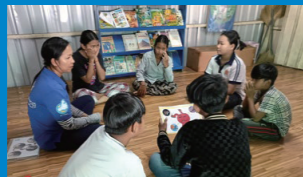
カンボジア：若者中心のワークショップ