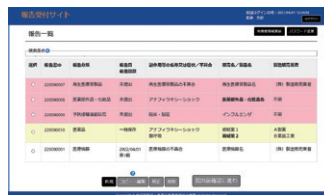
◀報告書登録済みの場合