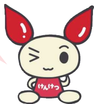
採血基準の主なもの