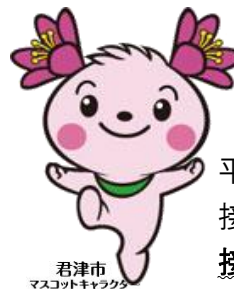
君津市 マスコットキャラクター きみびよん