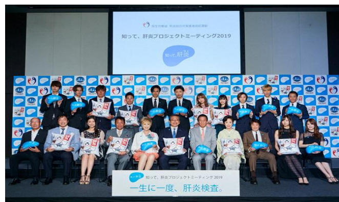
昨年のイベントの様子

つきましては、当日の開催概要をまとめた報道資料をお送りします。ご多用中かと存じますが、ぜひご来場、ご取材いただきますよう、お願い申し上げます。