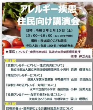
茨城県 住民向けアレルギー疾患講演会