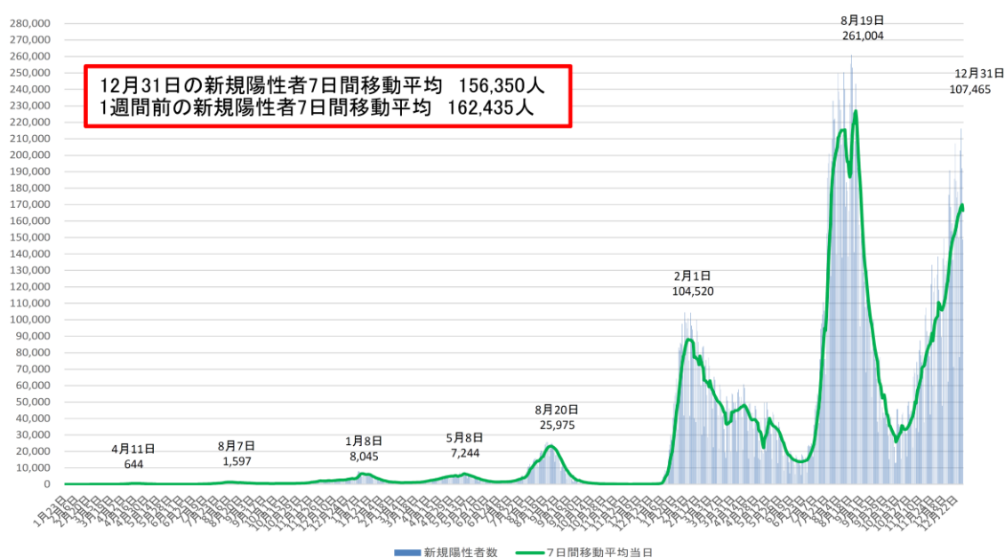
図 II-1. 新型コロナウイルス感染症の国内発生動向（令和 4 年 12 月 31 日）

日本では 2020 年 1 月 15 日に中国武漢市に滞在歴がある肺炎の患者が COVID-19 国内初症例として報告された。その後クルーズ船（ダイヤモンド・プリンセス号）や武漢市からの帰国者の感染者が報告され、翌 3 月には欧米などでの感染が疑われる患者の報告が増加し、その後 4 月上旬をピークに流行が認められた（いわゆる第 1 波）。次いで 6 月中旬から大都市を中心に 20～30 代の患者が増加し、8 月上旬をピークとしたいわゆる第 2 波、2021 年 1 月上旬（いわゆる第 3 波）、5 月上旬（アルファ株中心のいわゆる第 4 波）、8 月下旬（デルタ株中心のいわゆる第 5 波）、2022 年 2 月上旬（オミクロン株 BA.1、BA.2 系統中心のいわゆる第 6 波）、7 月下旬（オミクロン株 BA.5 系統中心）をそれぞれピークとする流行が発生した。令和 4 年 12 月 31 日 0:00 現在、国内での新型コロナウイルス感染症の感染者は 29,212,535 名（うち、空港・海港検疫事例 22,672 名）、死亡者は 57,266 名が確認されている（図 II-1） 1 。