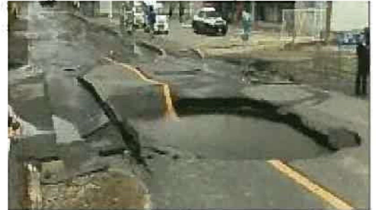
大阪府北部を震源とする地震における送水管の破損現場

基幹管路の耐震適合率について、38.7% (2016年度末実績) を2022年度末に50%にする (2018年度以降、年2% (約2,000km) のペースに引き上げを実施)