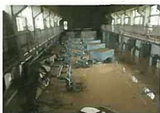
浸水被害を受けたポンプ施設