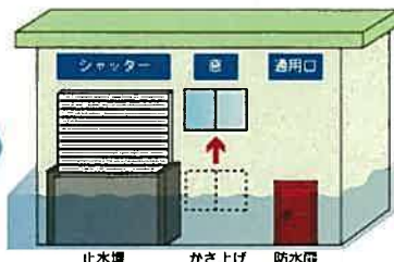
浸水対策のイメージ