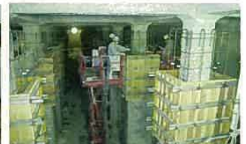
配水池の耐震化工事 (内面からの壁・柱等の補強)