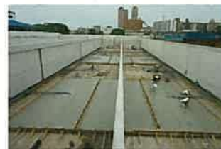
浄水場の耐震化工事 (内面からの壁等の補強)