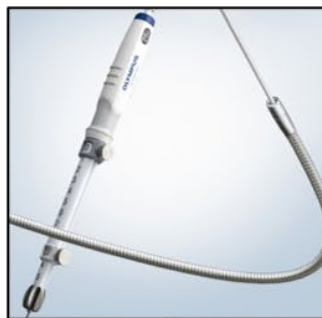
超音波内視鏡下穿刺針 (オリンパス NA-U200H)