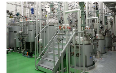
パイロット培養設備