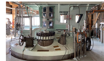
発酵槽封じ込め設備