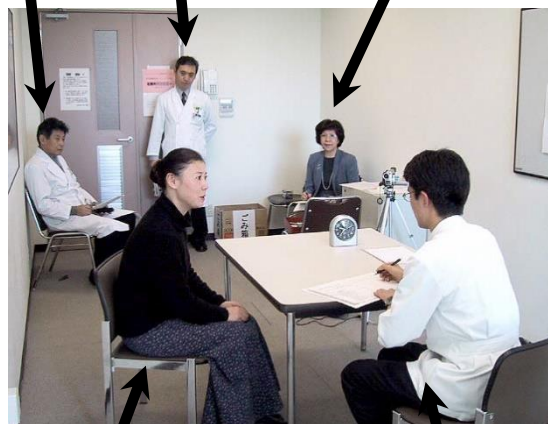
模擬患者 (SP) 学生