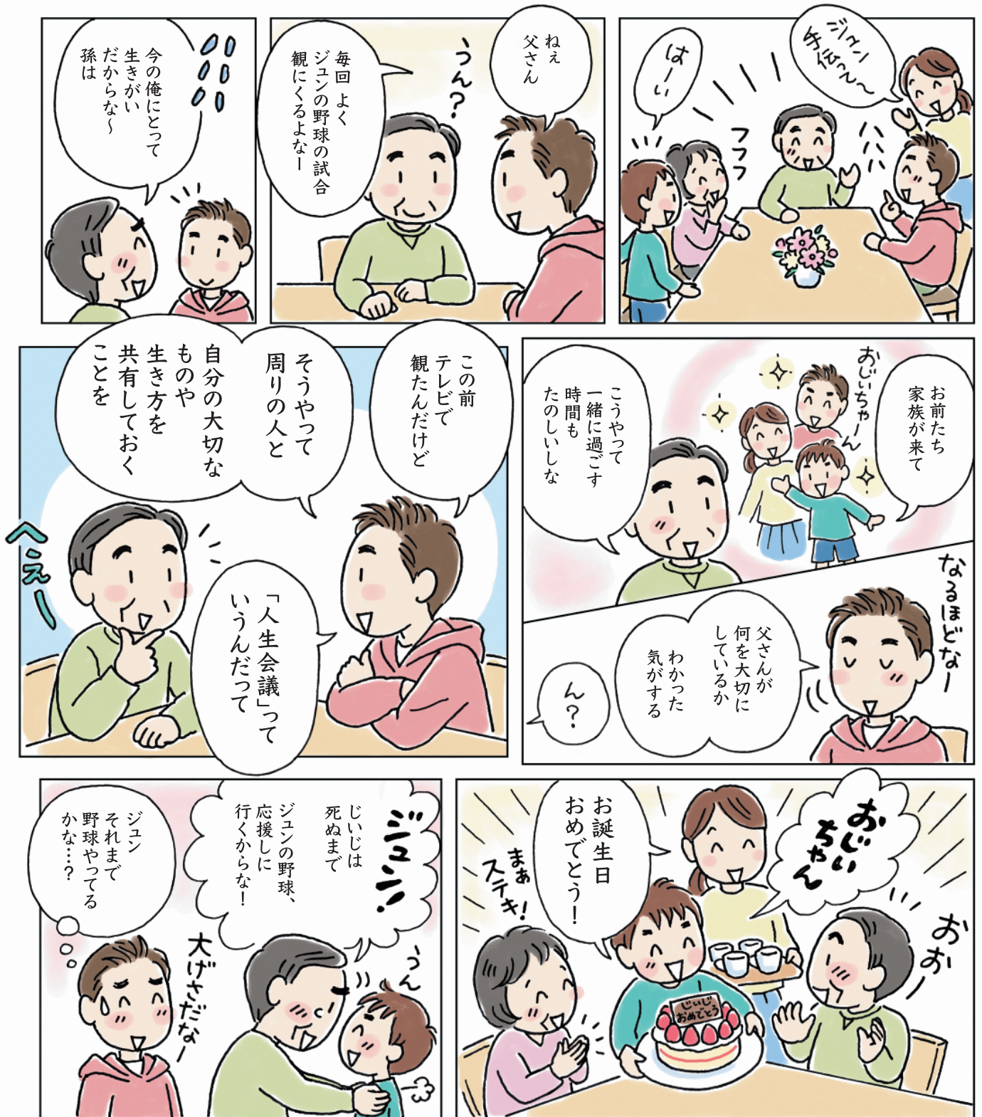
イラスト/漫画: 幡谷智子