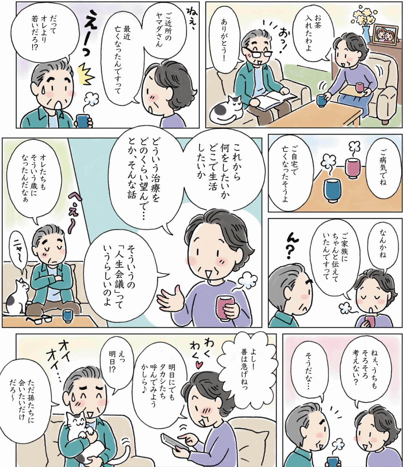
イラスト/漫画: 幅谷智子