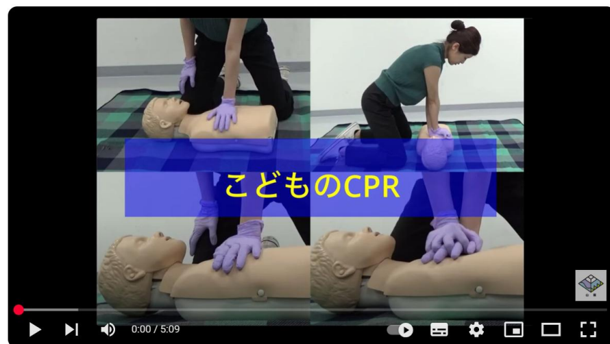
「子どもの命を救う心肺蘇生法」⑤乳児CPR（心肺蘇生法）、(5分) 説明