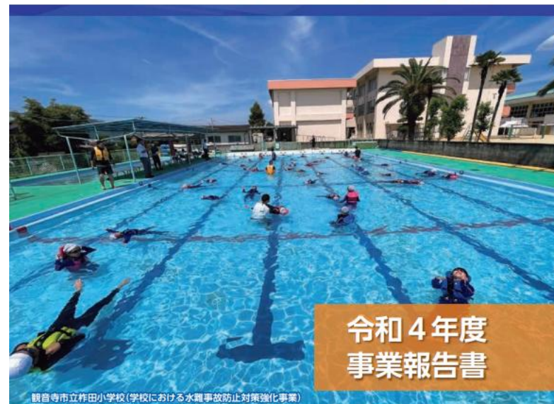
観音寺市立作田小学校(学校における水難事故防止対策強化事業)

海や川、池などで様々な活動を行うことは、自然に囲まれた日本で生活する私たちにとって日常的なものであります。しかし、毎年のように水難事故は発生しており、児童生徒等がそれらの事故で命を落とすこともしばしばあります。降水量が少なく渇水の多い香川県では、古くから農業用水をためるため県内各地にため池が多くあり、海や川だけでなく、ため池に係る事故も発生しています。