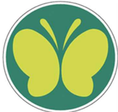
【聴覚障害者標識 (聴覚障害者マーク)】 所管：警察庁