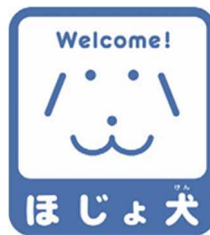
【ほじょ犬マーク】 所管：厚生労働省