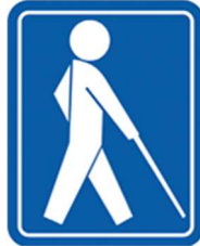
【盲者のための国際シンボルマーク】 所管：社会福祉法人日本盲人福祉委員会