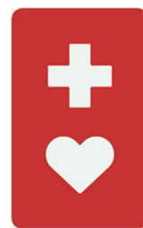
【ヘルプマーク】 所管：東京都