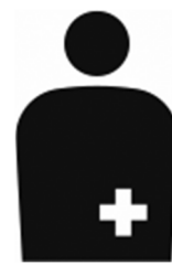
【オストメイト用設備/オストメイト】 所管：公益財団法人 交通エコロジー・モビリティ財団