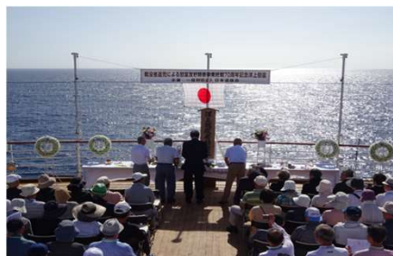
洋上慰霊(平成27年度)の様子

昭和館等において戦後80年シンポジウムや作文コンクールを行う他、しよつけい館において記念企画展等を行う。