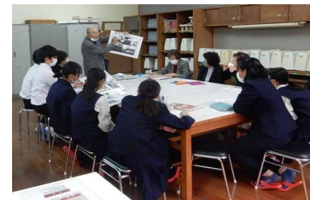
平和の語り部事業(対話型講話)の様子