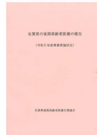
「佐賀県の後期高齢者医療の状況」