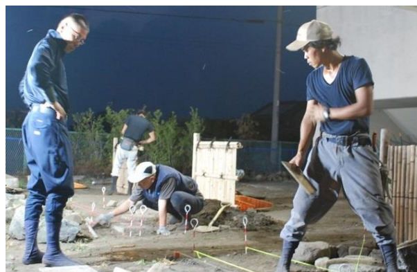
↑造園専攻科は技能検定1級を目指して