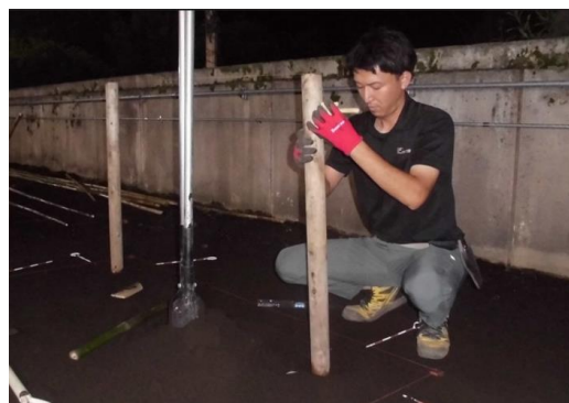
↑造園科の実習で四ツ目垣づくり