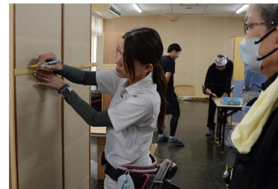
↑内装仕上施工科の壁装コース