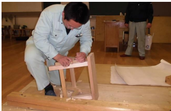
↑木造建築科の実習