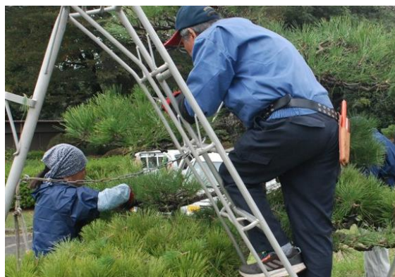
↑造園剪定科で樹木の剪定実習