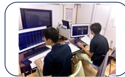
↑学科設備も整っています。