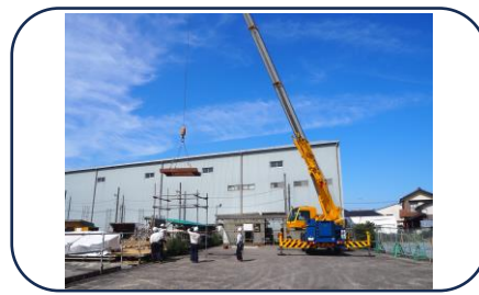
↑10月には玉掛合図訓練を行います。